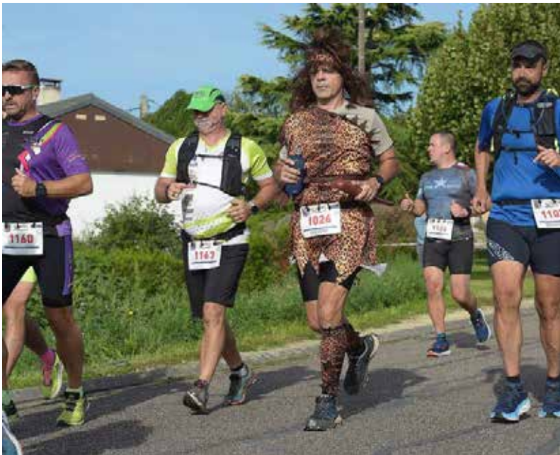
Chaudeney-sur-Moselle • Le ravitaillement à la Caldé est à base de produits locaux