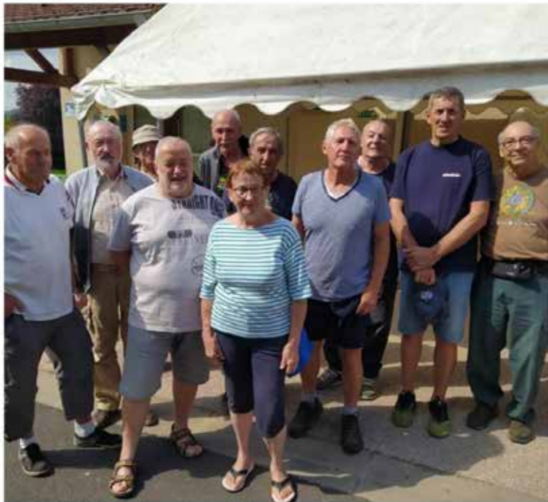
Une équipe de bénévoles toujours fidèle.

Au vu des inscriptions reçues à ce jour, les organisateurs s'attendent à voir plus de 1200 participants sur les trois épreuves. Côté météo, la pluie a toujours épargné la Caldé, on croise les doigts. Précision, les inscriptions se font uniquement sur internet, aucune inscription ne pourra être prise sur place le jour de la course.