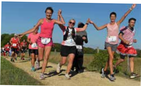
Entre course/randonnée et festivités, venez-vous dépasser et vous amuser sur la 35e Caldénicienne le dimanche 3 septembre.