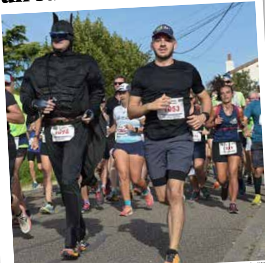
Avec une affluence gratuite de plus de 25% en deux éditions, la course de Chaudeney-sur-Moselle a effectué son retour au premier plan pour cette rentrée.